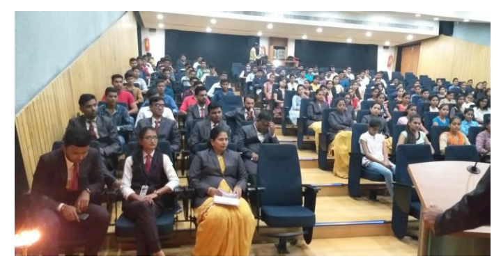
Students present for the MCA Induction.