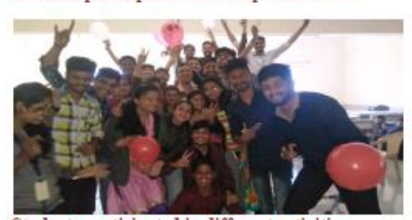
Students participated in different activities.