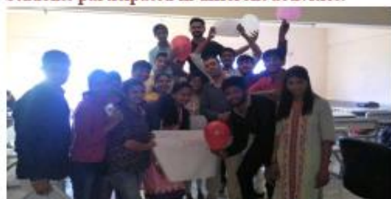
Product selling activity done by students in training.