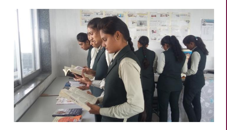
Students while reading books