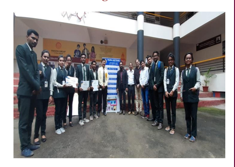
The Winners, participants and staff at PINNACLE 2019