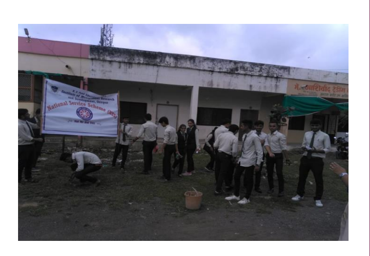
Cleanliness by NSS Volunteers