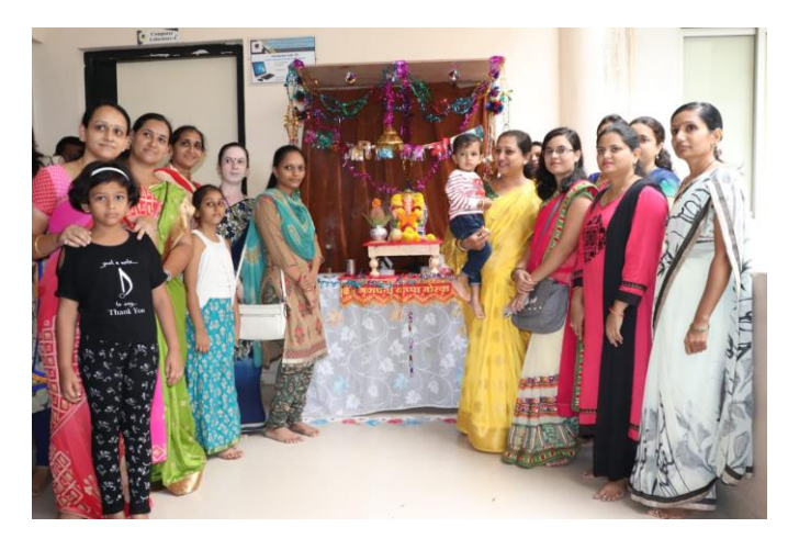
Faculties of IMRD while celebrating Ganesh Festival