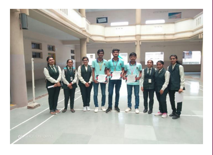
The winners of Teacher's day best message competition