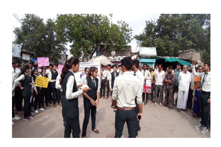
NSS Volunteers Presented Street Play on Plastic and Tobacco free Life