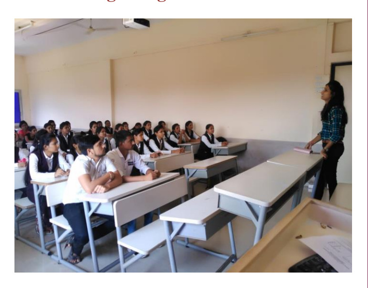
Students attending the session