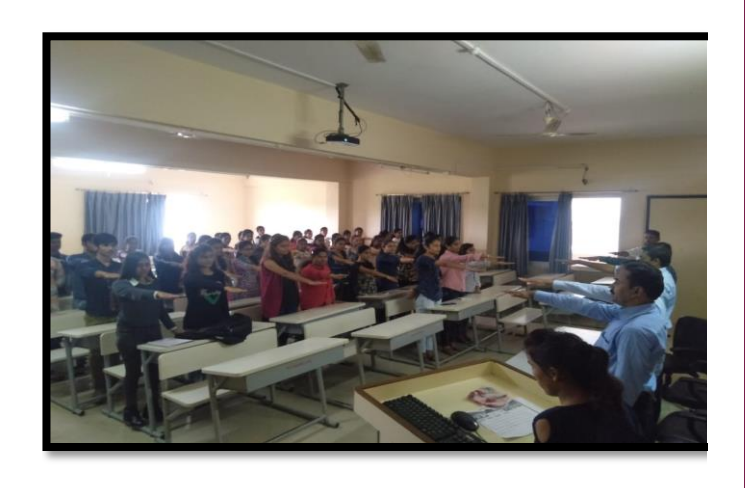
Oath of unity by Institute Staff and NSS Volunteers