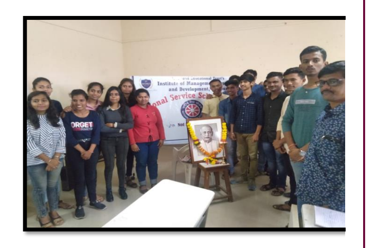
Participation of NSS Volunteers in National Unity Day Program