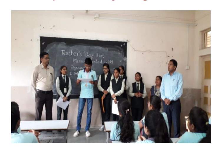
The winner while reading best message