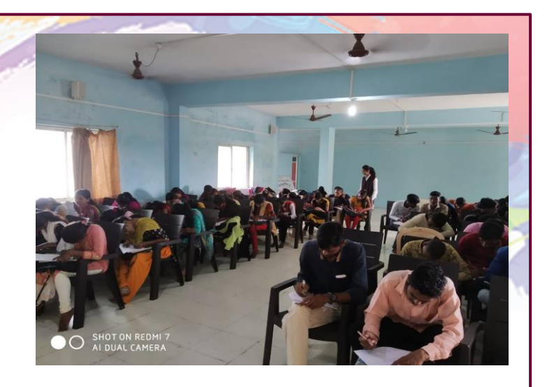
Teacher's day best message contest 2019