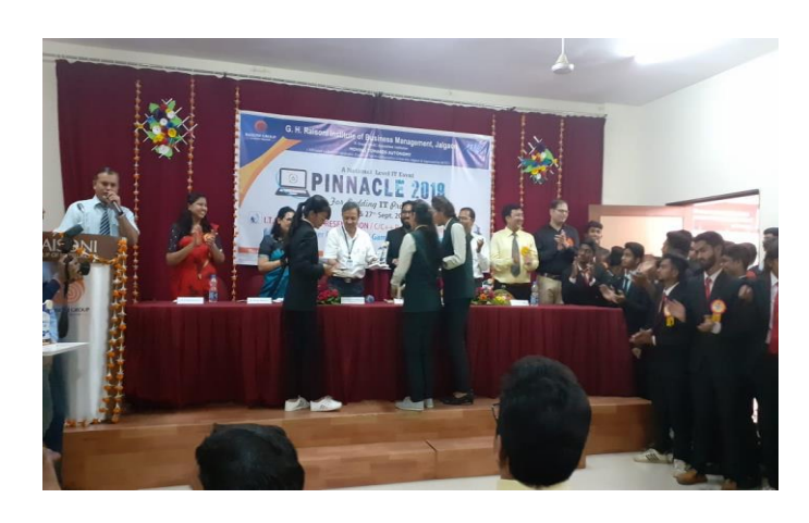
The Winners while receiving awards from dignitaries